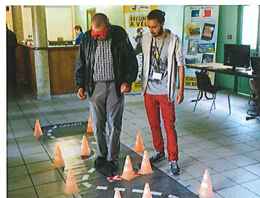
Atelier prévention du risque alcool/stupéfiants lors du rallye senior