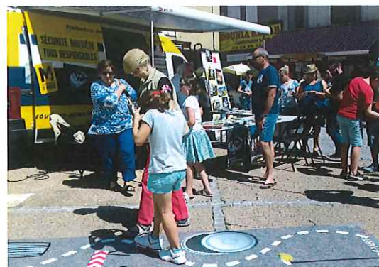
Stand Sécurité Routière lors de la fête du couteau de Nontron

- 17 et 25 octobre 2017, Lycée de Thiviers, élèves de 1 ère (MSR, Gendarmerie, IDSR)