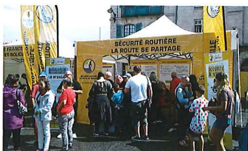
Stand Sécurité Routière lors du Tour de France